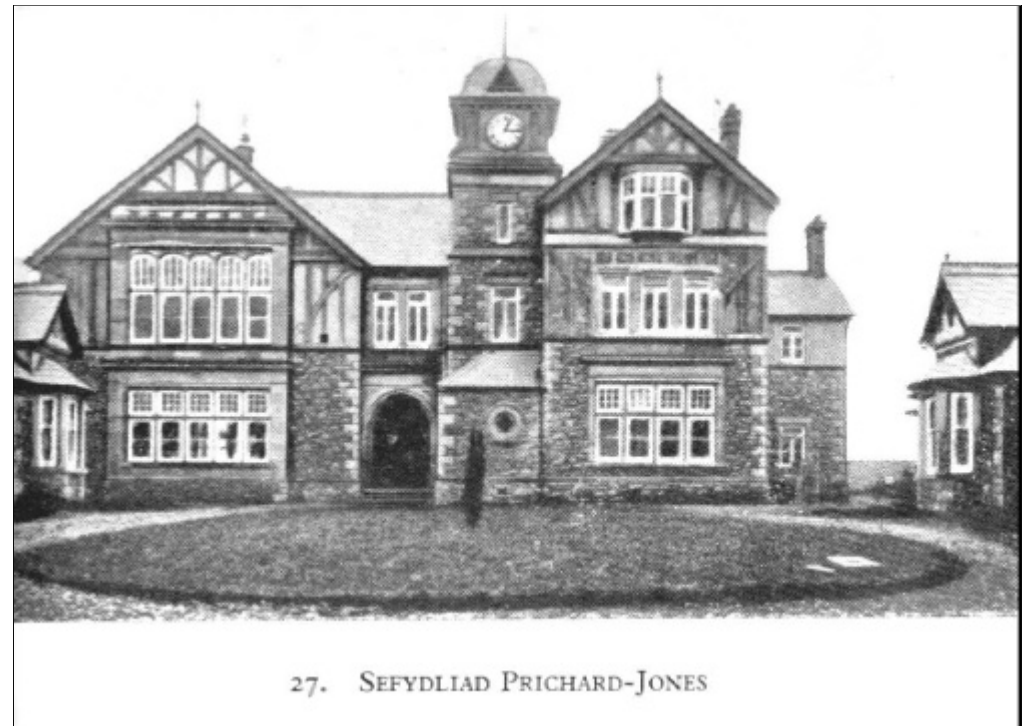
Fig. 27 Sefydliad Prichard-Jones [Prichard-Jones Hall]

Yr oedd Syr John wedi prynu eiddo ynghanol dinas Llundain, gwaith rhyw bum munud o gerdded oddi wrth y Bank of England , a chynhyrchai yr eiddo y pryd hynny , 255 y flwyddyn; ond erbyn 1905 yr oedd wedi ei brisio i ddwyn ardreth flynyddol o , 900. Yn ôl y gweithredoedd fe osodir allan fod unrhyw swm a geir oddi wrth yr eiddo uwchlaw ,255 i gael ei dalu i Gyngor Sirol Môn, a hwythau mewn ymgynghoriad ag awdurdodau Coleg y Brifysgol ym Mangor i'w roddi i gynorthwyo bechgyn a genethod o'r ardal hon ym Môn i gael addysg uwchraddol.