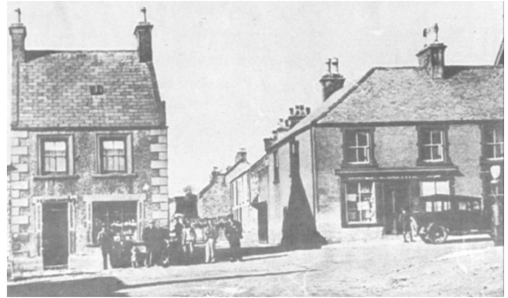
Fig. 27a Stryd Fawr, Niwbwrch yn y 1920s [High Street, Newborough in the 1920s]

I adnabod pobl, rhaid byw gyda hwy; dyna paham y dylid cymryd barn dieithriaid amdanynt cum grano salis . Pobl wresog eu teimladau a hawdd eu cynhyrfu yw trigolion Niwbwrch. Eglura hyn y rhan flaenllaw a gymerwyd ganddynt yn yr Adfywiad Methodistiaid cyntaf, ac wedyn yn 1859. Bydd ryw gynnwrf yn Niwbwrch ynglŷn â phob etholiad, ond bidd Llangaffo a Dwyrân yn dawel a di-stêr. Yr enghraifft ddiwethaf o hyn yw penderfyniad y plwyfolion na fynnent eu rhwystro i fyned i Ynys Llanddwyn pan fynnent.