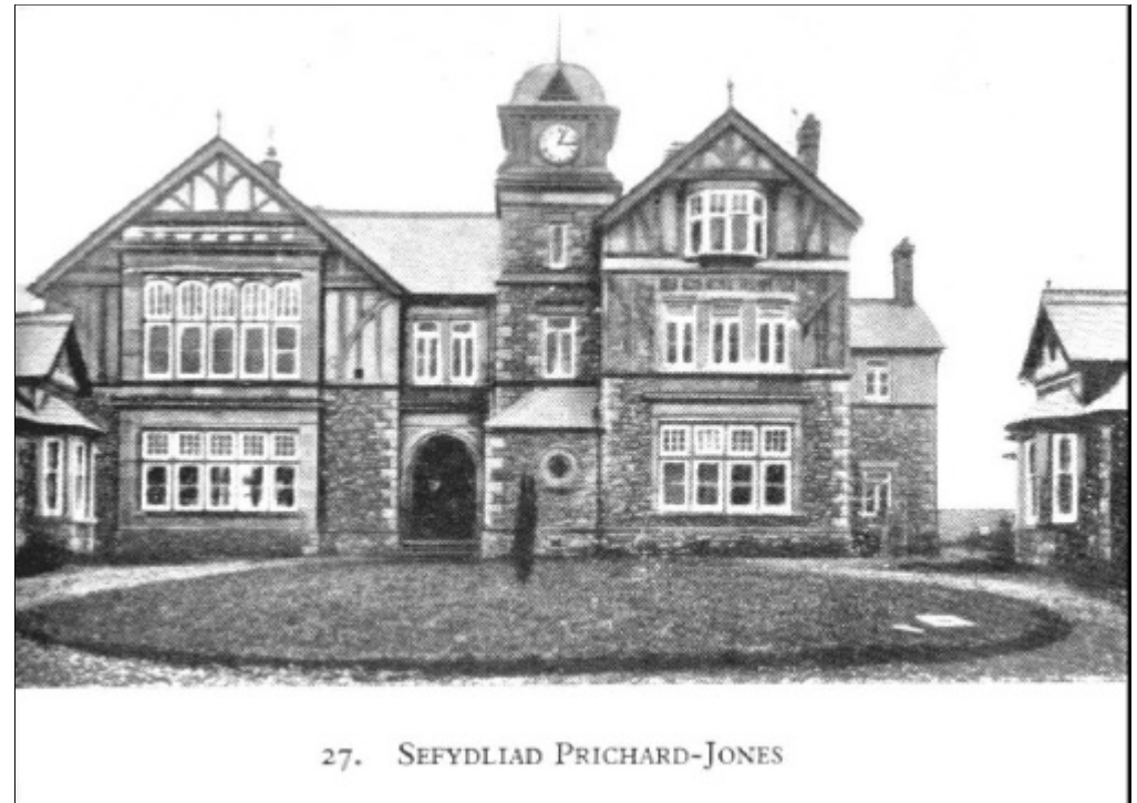
Fig. 27 Sefydliad Prichard-Jones [Prichard-Jones Hall]

Yr oedd Syr John wedi prynu eiddo ynghanol dinas Llundain, gwaith rhyw bum munud o gerdded oddi wrth y Bank of England , a chynhyrchai yr eiddo y pryd hynny , 255 y flwyddyn; ond erbyn 1905 yr oedd wedi ei brisio i ddwyn ardreth flynyddol o , 900. Yn ôl y gweithredoedd fe osodir allan fod unrhyw swm a geir oddi wrth yr eiddo uwchlaw ,255 i gael ei dalu i Gyngor Sirol Môn, a hwythau mewn ymgynghoriad ag awdurdodau Coleg y Brifysgol ym Mangor i'w roddi i gynorthwyo bechgyn a genethod o'r ardal hon ym Môn i gael addysg uwchraddol.